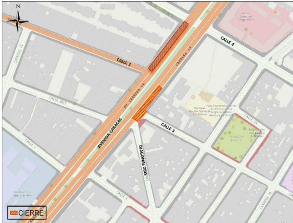
Mapa No 1. Zona de obra

Con el fin de facilitar la ejecución de las actividades y garantizar la seguridad a los usuarios de la vía, la SDM autorizó el PMT que se describe a continuación.