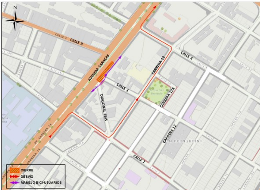
Mapa 3. Desvío transporte particular.