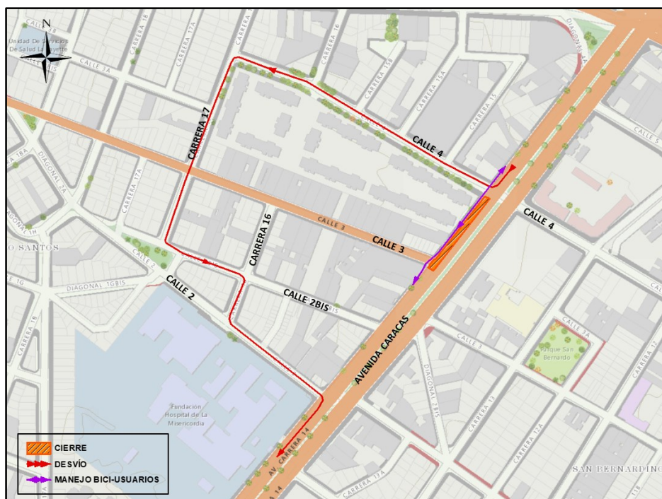
Mapa 2. Desvío transporte particular.