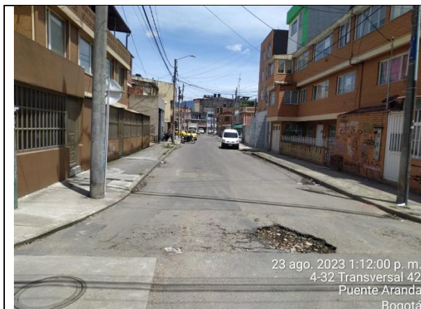
Foto 1. Calle 4 con Transversal 42. Vista oriente.