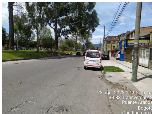
Foto 2. Transversal 42 con Calle 4. Vista norte.