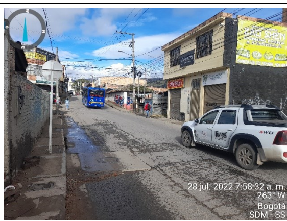
Foto 2. Panorámica Carrera 14 con calle 137B sur, vista al Occidente