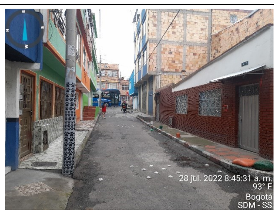
Foto 6. Panorámica Calle 74B Bis sur, con carrera 14C sur, vista al Oriente