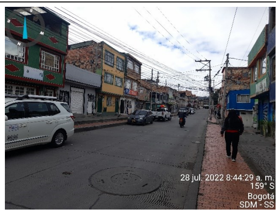
Foto 8. Panorámica Carrera 14Cr con Cale 74B Bis sur, vista al Sur