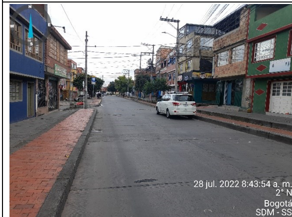
Foto 7. Panorámica Carrera 14Cr con Cale 74B Bis sur, vista al Norte