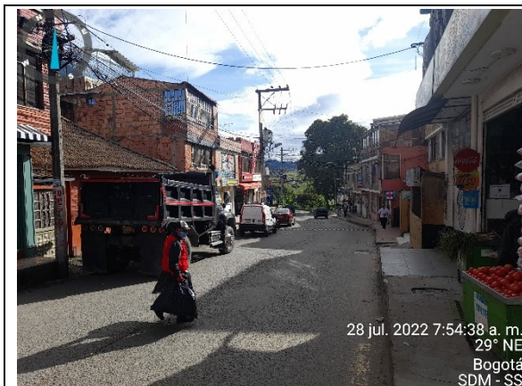
Foto 1. Panorámica Carrera 14 con calle 136 sur, vista al Norte

A continuación, se presenta registro fotográfico de la visita técnica realizada el día 28 de julio de 2022: