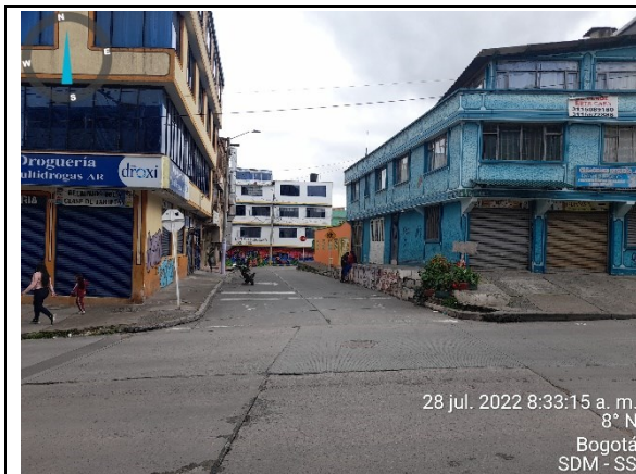
Foto 11. Panorámica Carrera 2 Este con calle 81sur, vista al Norte.

A continuación, se presenta registro fotográfico de la visita técnica realizada el día 28 de julio de 2022: