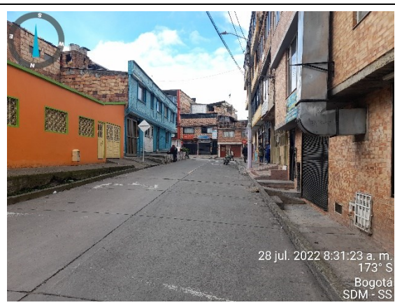
Foto 12. Panorámica Carrera 2 Este con calle 81sur, vista al Sur.