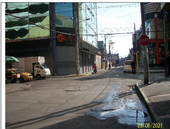
Foto 1. Panorámica Carrera 21 Con Calle 10 Vista al Norte.

A continuación, se presenta el registro fotográfico de la visita técnica realizada el día 23 de junio de 2021.