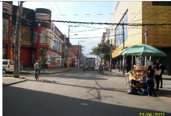
Foto 4. Panorámica Calle 10 con Carrera 21, Vista al Oriente.