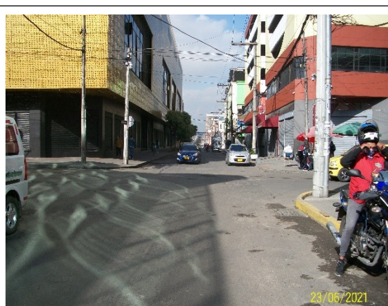
Foto 2. Panorámica Carrera 21 Con Calle 10 Vista al Norte.