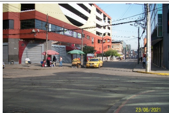
Foto 3. Panorámica Calle 10 con Carrera 21, Vista al Occidente.