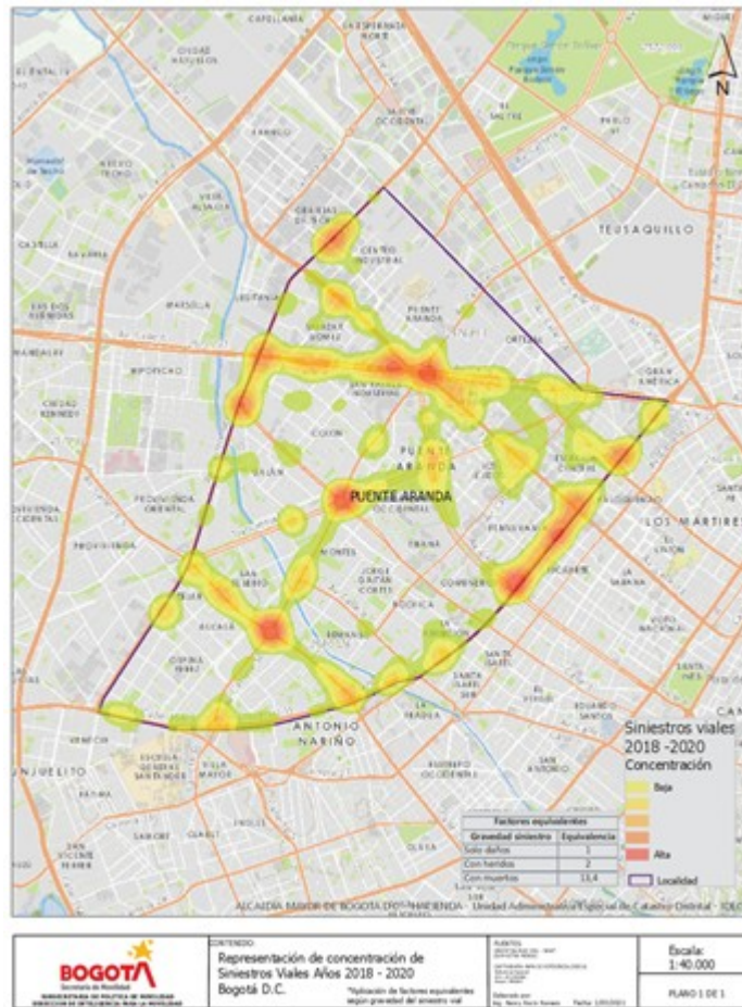
Ilustración 2. Mapa de densidad de puntos de alta siniestralidad L16 - Puente Aranda