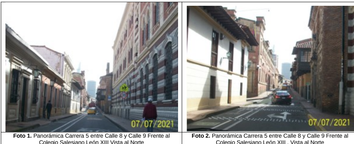
Foto 1. Panorámica Carrera 5 entre Calle 8 y Calle 9 Frente al Colegio Salesiano León XIII Vista al Norte