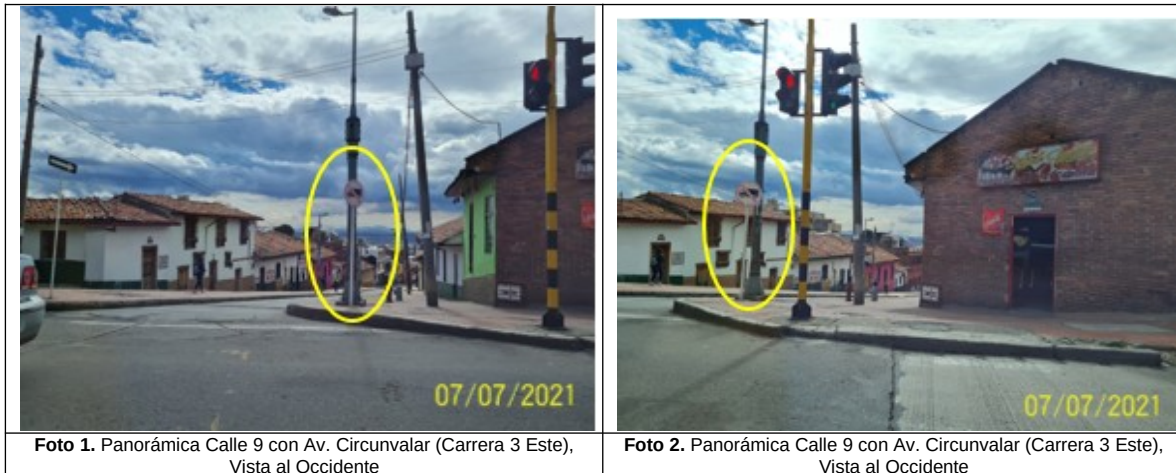
Foto 1. Panorámica Calle 9 con Av. Circunvalar (Carrera 3 Este), Vista al Occidente