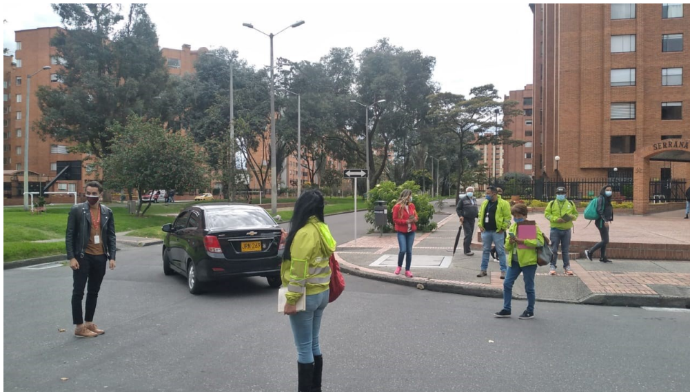
Evidencia fotográfica del trabajo social – pedagógico conjunto en el sector.

Seguiremos trabajando en las medidas pedagógicas, sin bajar la guardia en las medidas correctivas, las gestiones con las entidades de control de salud, seguridad y gobierno y la disuasión para el buen manejo del espacio público, siendo todo el conjunto necesario para manejar la movilidad, la seguridad y la reactivación económica que nos beneficia a todos.