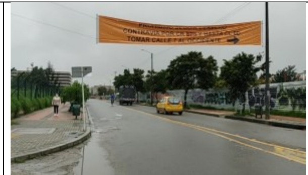
CL 7 con KR 87B - Vista al sur – información sobre desvío por CL 7 por piloto de cambio de sentido vial.