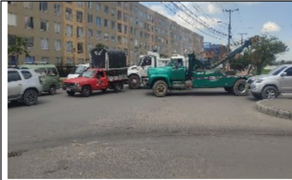
CL6D con KR 87B - Vista al occidente – entrecruzamientos para incorporación hacia el oriente.