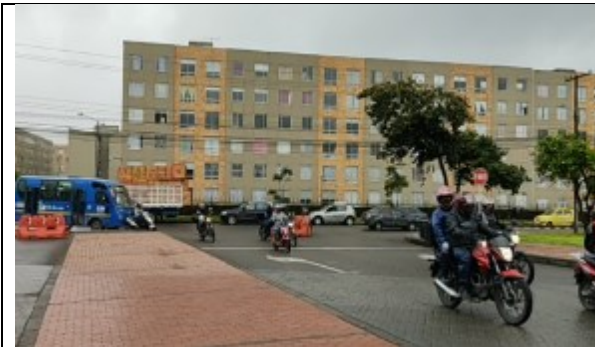
CL 6D con KR 87B - Vista al occidente – Piloto en funcionamiento tramo en sentido unidireccional Sur Norte.