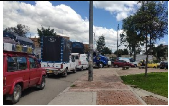
CL 9 con KR 87B - Vista al norte – entrecruzamientos para incorporación hacia el oriente.

Así las cosas, la Subdirección de Gestión en Vía, realizó la implementación de una prueba piloto desde el 8 de junio hasta el 23 de julio de 2021, realizando el cambio de sentido sobre la Carrera 87B entre Calles 6D y Calle 7, para que la operación en este tramo sea en sentido unidireccional Sur Norte, además se instaló una canalización del flujo vehicular sobre la calle 9 con carrera 87B para evitar el giro en U y de esta forma evaluar el comportamiento de los usuarios, la reducción de conflictos, la congestión vehicular y tendencias de la velocidad en el sector, tal como se muestra el siguiente registro fotográfico.