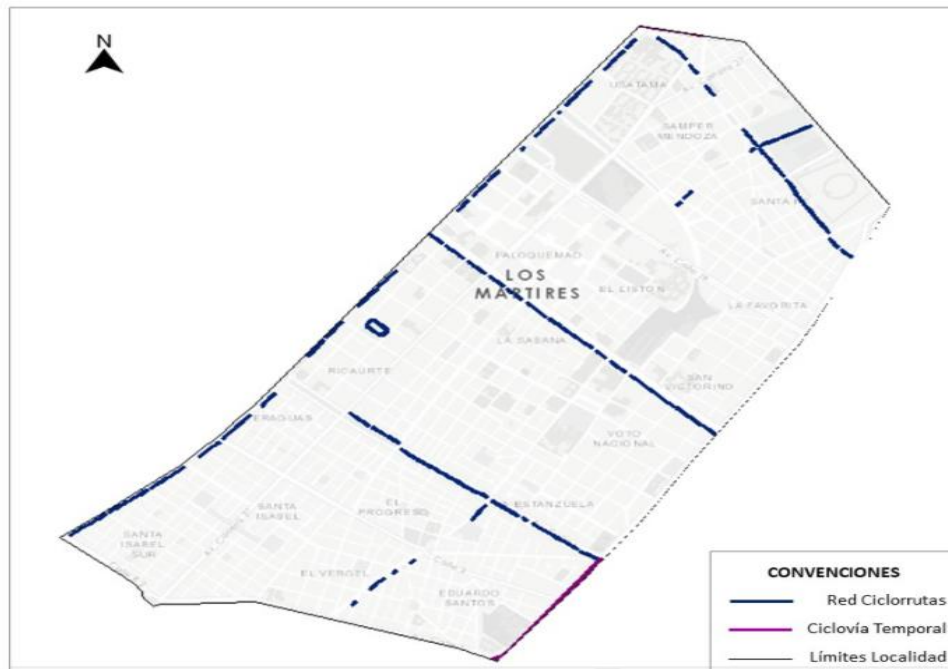
Ilustración 1. Red de Ciclorrutas de la Localidad de Bosa

Es importante señalar que en la localidad de Bosa se realizan aproximadamente 174.953 viajes en bicicleta al día, lo que equivale al 19,9% del total de viajes realizados en este medio de transporte en la ciudad, según la encuesta distrital de movilidad realizada en el 2019.