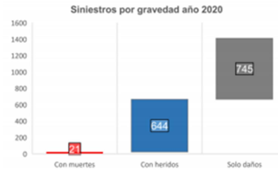
Gráfica 1. Siniestros por gravedad año 2020, Localidad Bosa Elaborado por Seguridad vial-SDM.