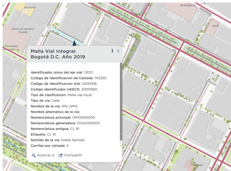
Imagen 2 Tramos malla vial local