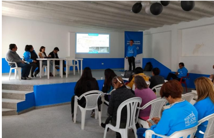
Imagen 6: Diálogo Ciudadano de la SDM en Suba. Salón comunal, Barrio Lisboa.