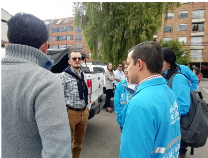
Imagen 4: Diálogo Ciudadano de la SDM en Suba. Punto A, Barrio Batán.

Las personas interesadas en dejar por escrito su requerimiento a la Secretaría, recibieron el “Formato para la formulación de preguntas”, las cuales, de acuerdo a la dinámica del recorrido, fueron ampliadas verbalmente por el solicitante y respondidas por parte de los funcionarios de la Secretaría Distrital de Movilidad. Las preguntas que por alguna circunstancia no lograron ser atendidas durante el recorrido o la reunión de diálogo ciudadano tendrán respuesta por escrito dentro de los diez (10) días hábiles siguientes a su recibimiento.