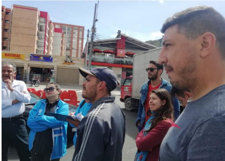
Imagen 5: Diálogo Ciudadano de la SDM en Suba. Punto B, Barrio Spring