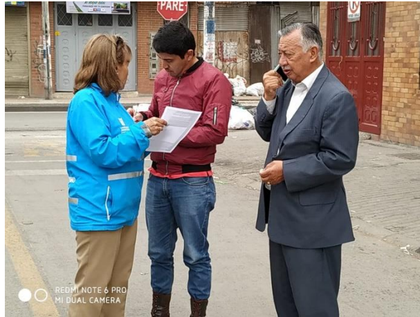
Imagen 1: Divulgación del Diálogo Ciudadano de la SDM en Suba.

Las siguientes fotografías evidencian el proceso de convocatoria a los diálogos ciudadanos en la localidad de Suba.