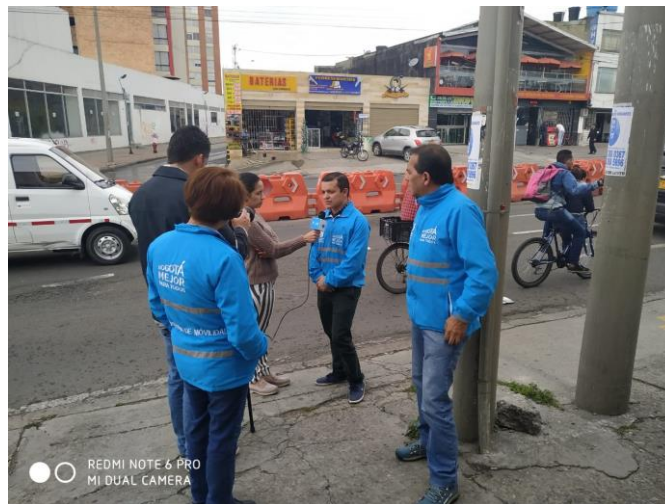
Imagen 2: Divulgación del Diálogo Ciudadano de la SDM en Suba.