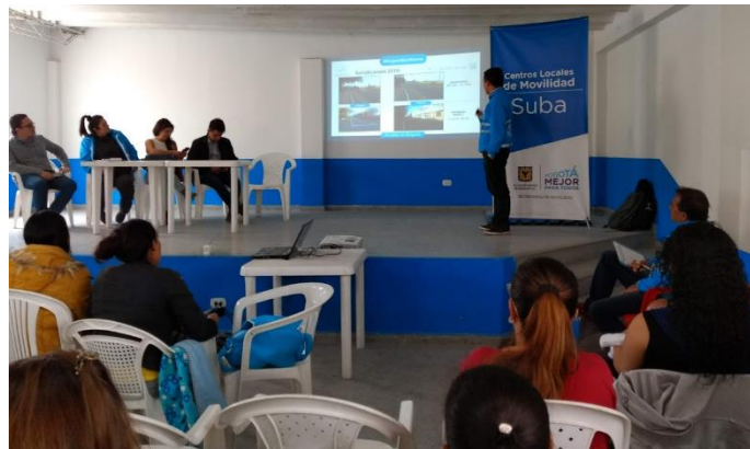
Imagen 7: Diálogo Ciudadano de la SDM en Suba. Salón Comunal, Barrio Lisboa.