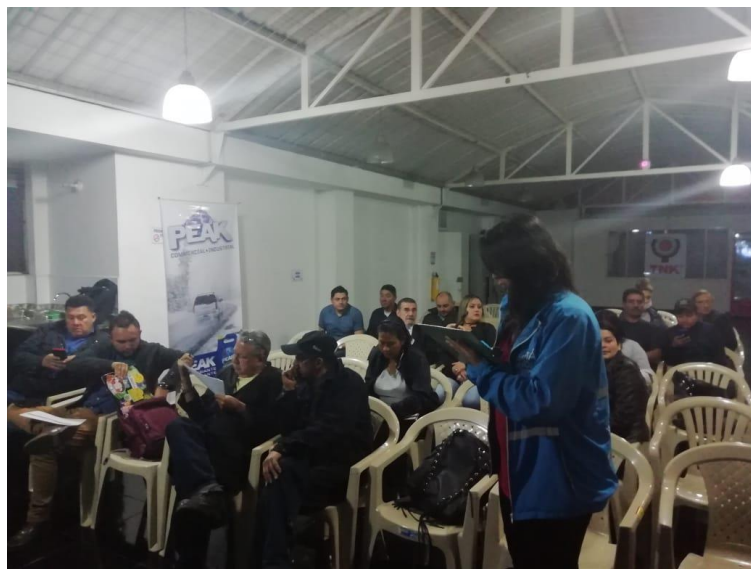
Imagen 2: Divulgación del Diálogo Ciudadano de la SDM en Mártires.