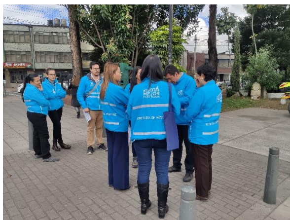
Imagen 4: Diálogo Ciudadano de la SDM en Mártires. Punto A, CAI Samper Mendoza.

Las personas interesadas en dejar por escrito su requerimiento a la Secretaría, recibieron el “Formato para la formulación de preguntas”, las cuales, de acuerdo a la dinámica del recorrido, fueron ampliadas verbalmente por el solicitante y respondidas por parte de los funcionarios de la Secretaría Distrital de Movilidad. Las preguntas que por alguna circunstancia no lograron ser atendidas durante el recorrido o la reunión de diálogo ciudadano tendrán respuesta por escrito dentro de los diez (10) días hábiles siguientes a su recibimiento.