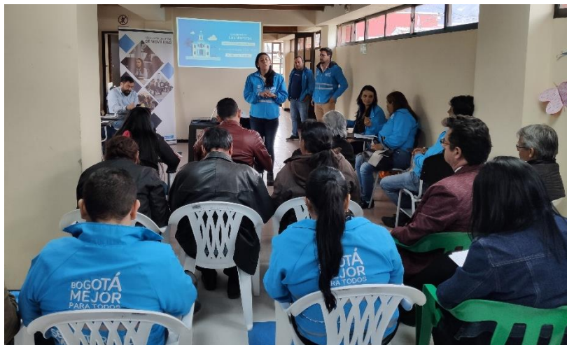
Imagen 6: Diálogo Ciudadano de la SDM en Mártires. Salón comunal, Plaza de Mercado Samper Mendoza.

Una vez se recogen los formularios de preguntas diligenciados, rápidamente se clasificaron por temáticas, para así darle la oportunidad a una persona por cada tema o situación para que amplié su pregunta. Todas las intervenciones realizadas tuvieron respuesta de parte del Subsecretario y/o de las directivas presentes y a quienes les compete cada tema. Las respuestas permitieron aclarar inquietudes, socializar avances y hacer compromisos.