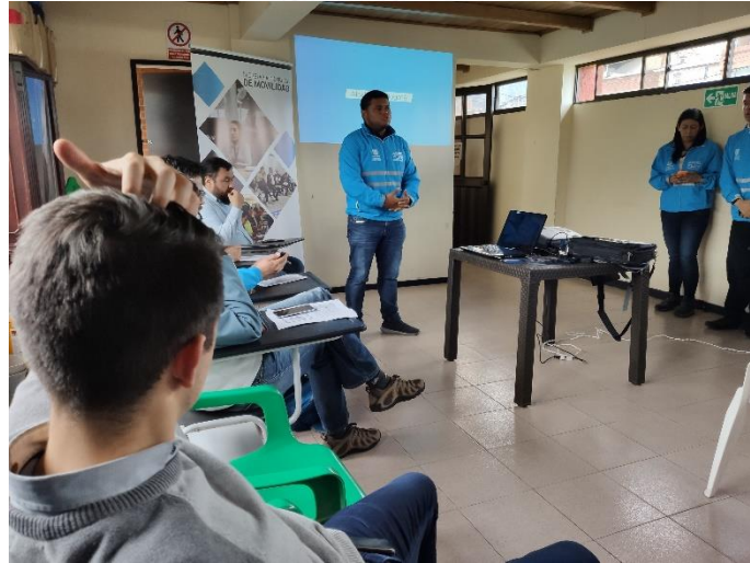
Imagen 7: Diálogo Ciudadano de la SDM en Mártires. Salón comunal, Plaza de Mercado Samper Mendoza.