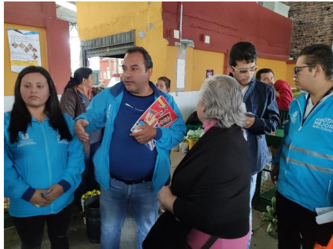
Imagen 6: Diálogo Ciudadano de la SDM en Mártires, Punto C, Plaza de Mercado Samper Mendoza.