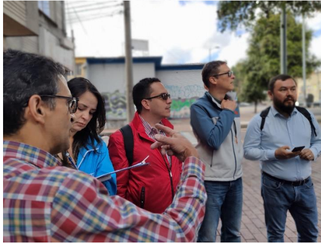
Imagen 5: Diálogo Ciudadano de la SDM en Mártires. Punto B, Carrera 24 con calle 23