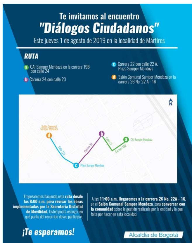
Imagen 3: Invitación con recorridos al Diálogo Ciudadano de la SDM en Mártires.

Para esta Localidad se determinaron cuatro puntos de encuentro, sin embargo, la actividad solo se logró realizar en 3, dos a manera de recorrido y uno de cierre en el salón de la Plaza Samper Mendoza, reemplazando el punto de reunión en el salón comunal del barrio que lleva el mismo nombre. Con esto se pretendió abarcar la mayor cantidad posible de puntos de interés e intervención de movilidad.