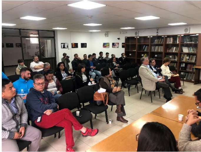
Imagen 5: Diálogo Ciudadano de la SDM en Chapinero. Alcaldía Local de Chapinero.