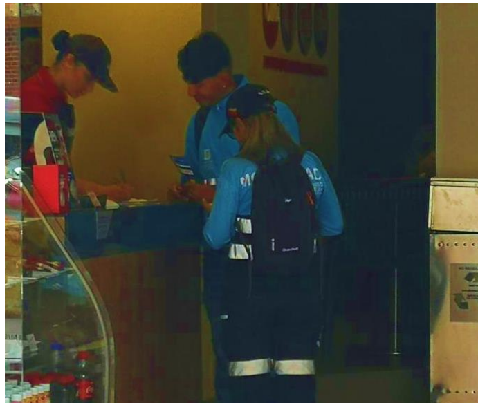
Imagen 1: Divulgación del Diálogo Ciudadano de la SDM en Chapinero.