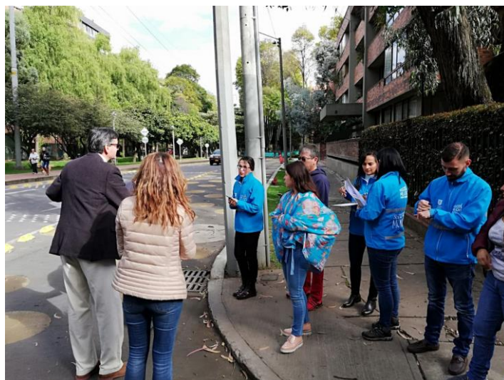
Imagen 4: Diálogo Ciudadano de la SDM en Chapinero. Punto B, Calle 88 entre carreras 12 y 13.