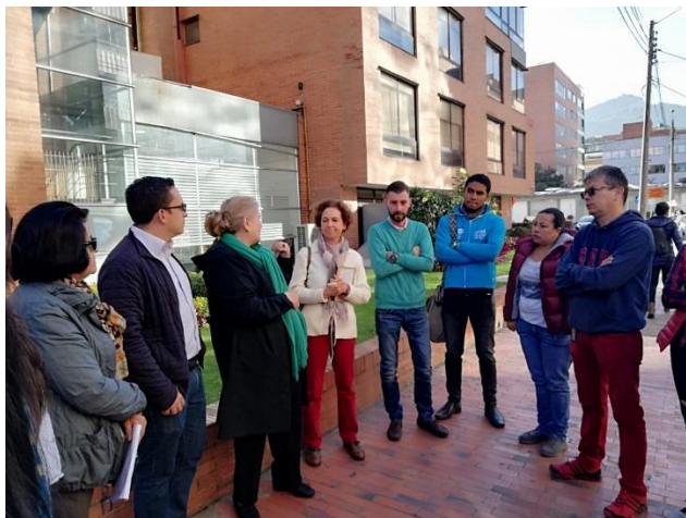
Imagen 3: Diálogo Ciudadano de la SDM en Chapinero. Punto A, Clínica de la Mujer

Las personas interesadas en dejar por escrito su requerimiento a la Secretaría, recibieron el “Formato para la formulación de preguntas”, las cuales, de acuerdo a la dinámica del recorrido, fueron ampliadas verbalmente por el solicitante y respondidas por parte de los funcionarios de la Secretaría Distrital de Movilidad. Las preguntas que por alguna circunstancia no lograron ser atendidas durante el recorrido tendrán respuesta por escrito dentro de los diez (10) días hábiles siguientes a su recibimiento.