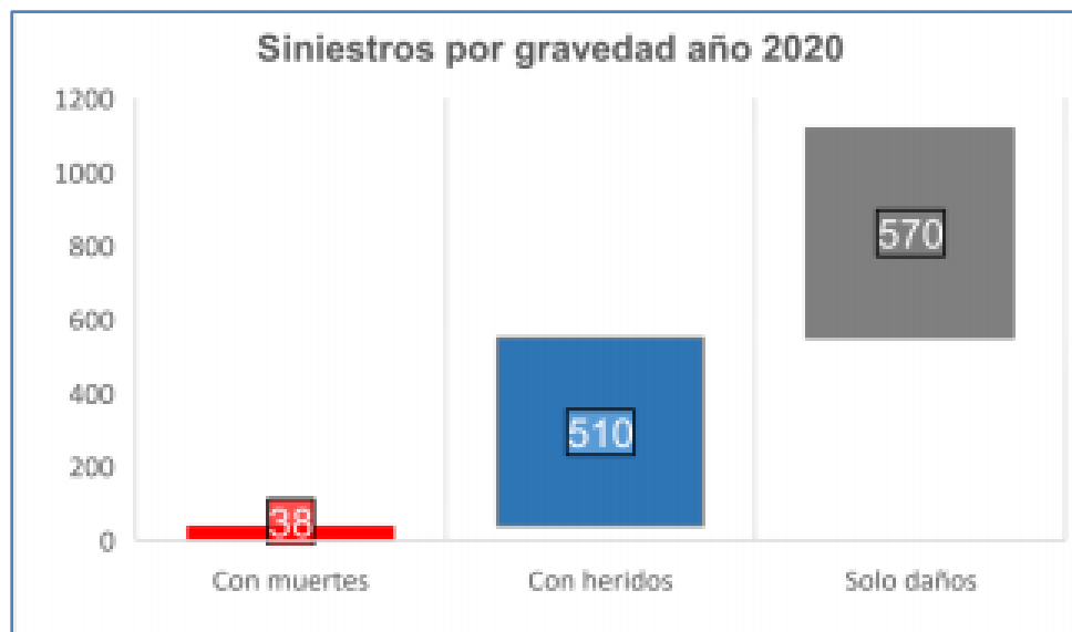
Gráfica 1. Siniestros por gravedad año 2020, Localidad Ciudad Bolívar Elaborado por Seguridad vial-SDM.