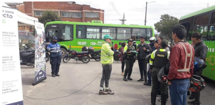
Imagen 2. Sensibilización jornadas en vía.

recorrido en bici, uso de los elementos de protección y el cumplimiento de las normas de tránsito, entre otros.