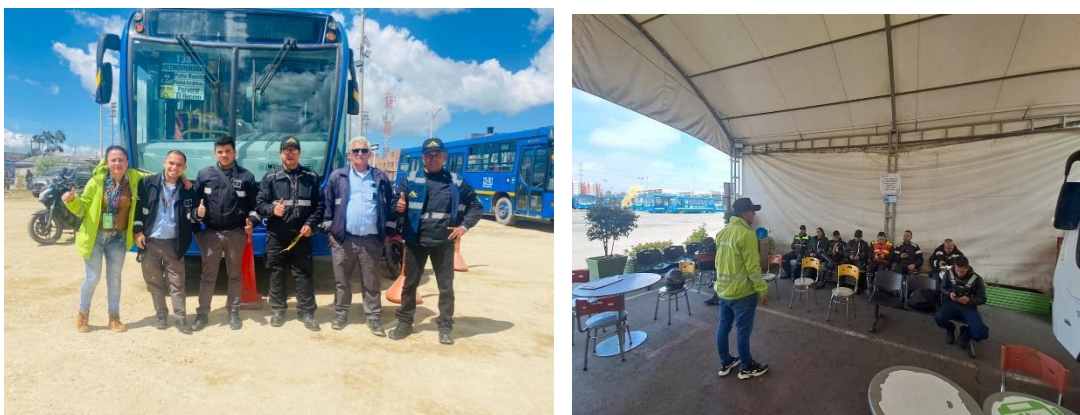
Imagen 1. Capacitaciones dirigidas a los operadores del sistema en temas de seguridad vial

De enero a diciembre de 2022 se realizaron 817 sesiones de capacitación dirigidas a 13.574 operadores del Sistema Integrado de Transporte Público en sus diferentes componentes. Por su parte, en enero de 2023 se realizaron 63 sesiones dirigidas a 840 operadores.