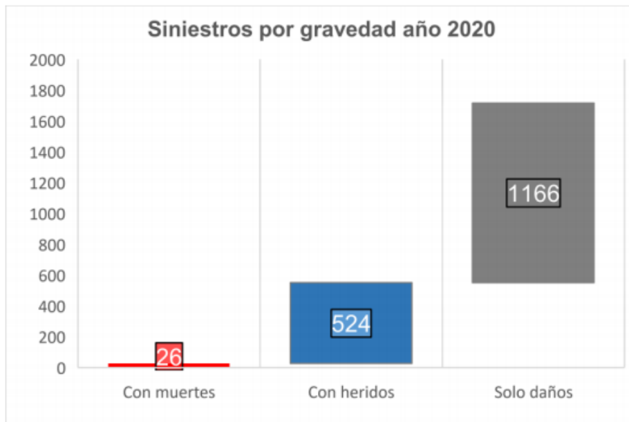
Gráfica 1. Siniestros por gravedad año 2020, Localidad Fontibón Elaborado por Seguridad vial-SDM.

Adicionalmente, el 68% de los siniestros viales corresponde a choques. Así mismo el 38% de las víctimas lesionadas son motociclistas y el 46% de las víctimas fatales son Motociclistas.