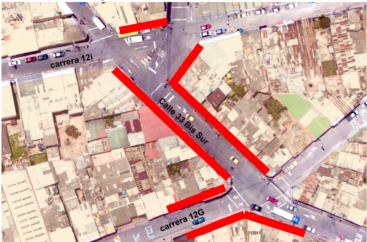
Figura 5. Ubicación Jornadas de Sensibilización