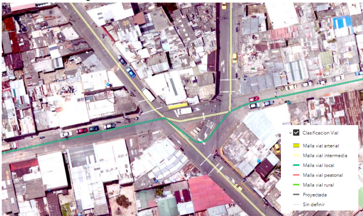
Figura 3. Clasificación vial carrera 12i x calle 33 Bis Sur