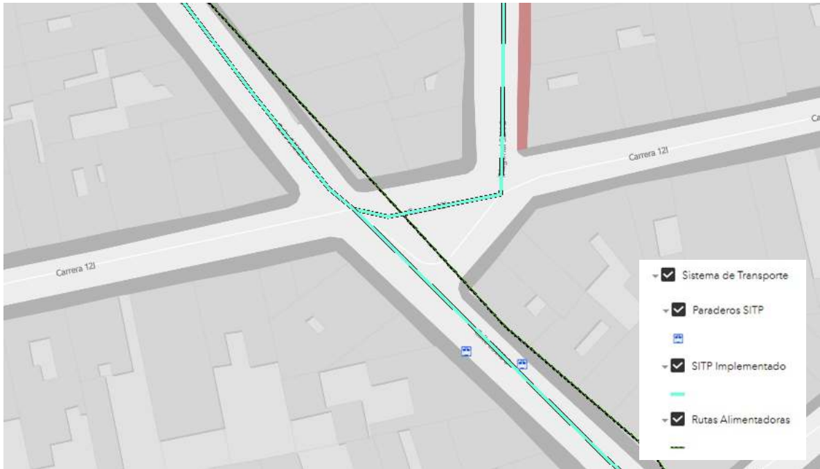
Figura 4. Sistema de Transporte