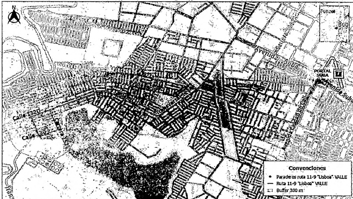
Figura 2. Trazado de la ruta 11-9 "Lisboa" con validación a bordo en horas valle.