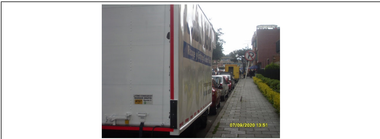
Fotografía 3. Carrera 69 por Calle 49A, se evidencia el parqueo de vehículos particulares.