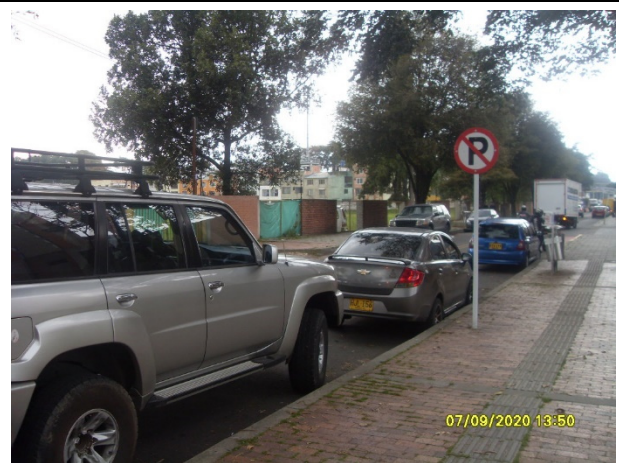
Fotografía 2. Carrera 69 por Calle 49A, se evidencia el parqueo de vehículos particulares.