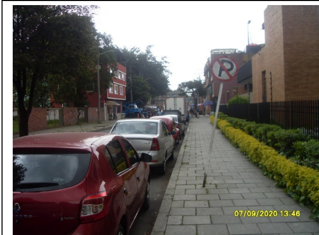
Fotografía 1. Carrera 69 por Calle 49A, se evidencia el parqueo de vehículos particulares.