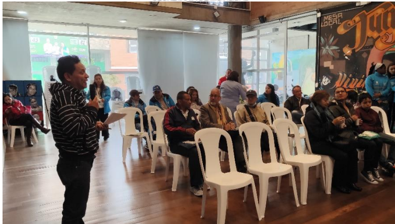
Imagen 3. Diálogo Ciudadano de la SDM en Tunjuelito. Casa de la Cultura, Dg 52D # 27-21.