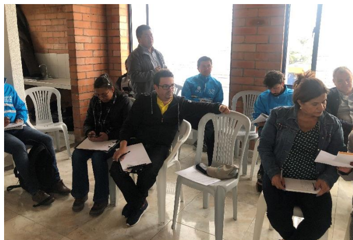
Imagen 4. Diálogo Ciudadano de la SDM en Tunjuelito. Casa de la Cultura, Dg 52D # 27-21.