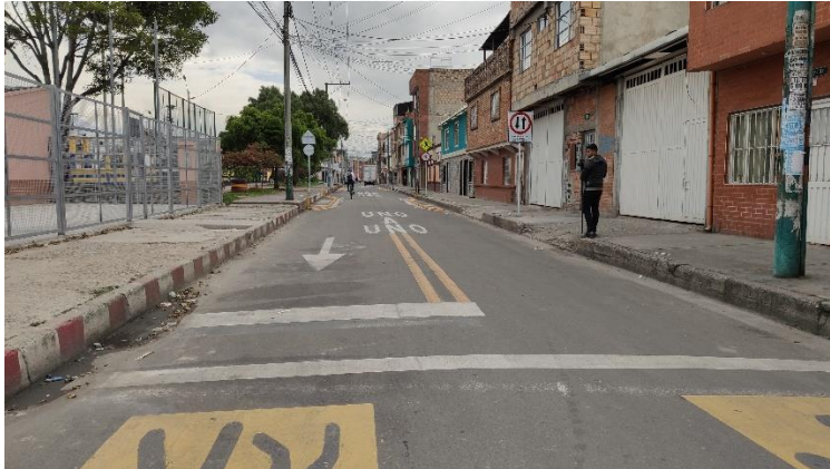
Imagen 5: Diálogo Ciudadano de la SDM en Tunjuellito. Punto B, Barrio Samoré, Carrera 28 con Calle 48C sur.