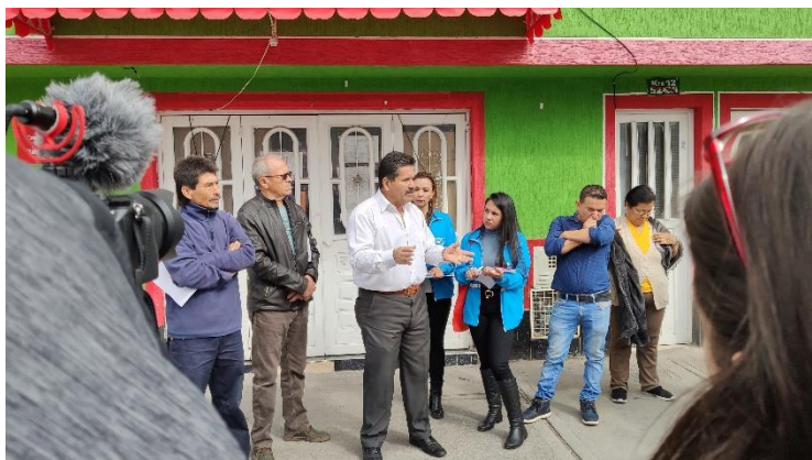
Imagen 2. Diálogo Ciudadano de la SDM en Tunjuelito Punto A, Barrio Abraham Lincon, Carrera 12 con Calle 52 sur.

Las personas interesadas en dejar por escrito su requerimiento a la Secretaría, recibieron el “Formato para la formulación de preguntas”, las cuales, de acuerdo a la dinámica del recorrido, fueron ampliadas verbalmente por el solicitante y respondidas por parte de los funcionarios de la Secretaría Distrital de Movilidad. Las preguntas que por alguna circunstancia no lograron ser atendidas durante el recorrido tendrán respuesta por escrito dentro de los diez (10) días hábiles siguientes a su recibimiento.