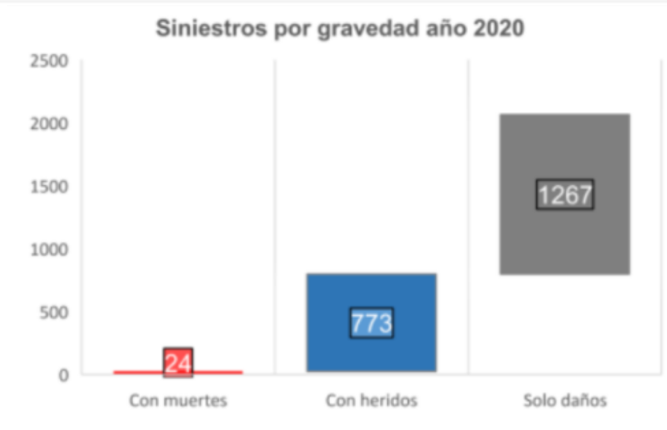
Gráfica 1. Siniestros por gravedad año 2020, Localidad Suba Elaborado por Seguridad vial-SDM.