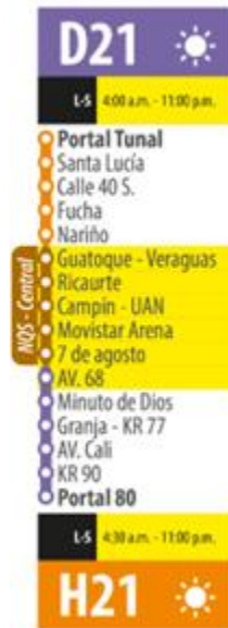
Ilustración 2. Paradas ruta D21 – H21.