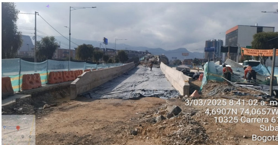
Puente vehicular sentido Norte -sur

Esperamos con la anterior información haber atendido de forma satisfactoria las inquietudes de competencia de esta Entidad y quedamos atentos ante cualquier requerimiento o aclaración adicional al respecto.