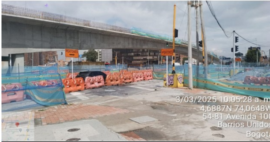
Vista general del puente vehicular, sentido sur-norte costado oriental