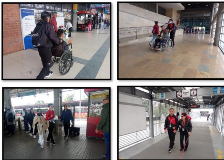
Imagen 1. Acompañamiento realizado por el personal de atención en vía.

TRANSMILENIO S.A. le informar que, desde la Subgerencia de Atención al Usuario y Comunicaciones, se programa personal de Atención en vía en estaciones y portales del Sistema manera rotativa y de acuerdo con las necesidades de la operación, orientando a la comunidad usuaria en su plan de viaje, informando sobre cambios operacionales y novedades en la vía oportunamente y apoyando a los usuarios para su adecuada ubicación y circulación, principalmente a personas con discapacidad, niños, personas mayores (62 años y más), mujeres en estado de gestación y madres lactantes. Como se evidencia en la Imagen 1.