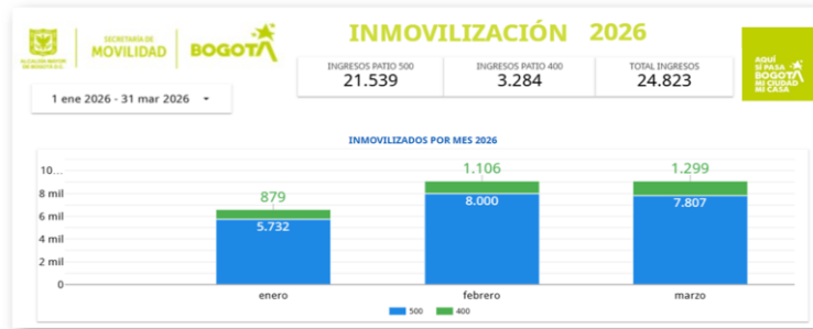
Tabla 4. Comportamiento Inmovilizaciones (01 enero 2026 - 31 de marzo 2026)

Comportamiento de inmovilizaciones primer trimestre de 2026