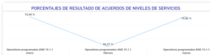
Tabla 5. Comportamiento ANS 15.1.1 (01 enero 2026 - 31 de marzo 2026)

En términos generales, el indicador presenta un comportamiento variable a lo largo del periodo, con una disminución intermedia y posterior estabilización en niveles cercanos al valor inicial.