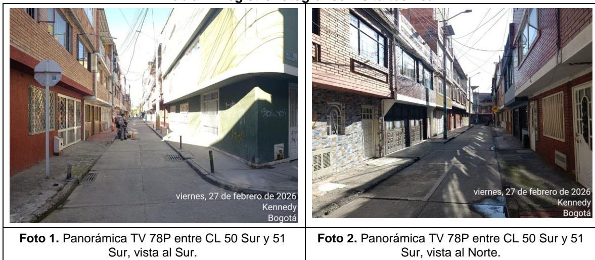
Tabla 1. Registro fotográfico visita técnica.

Por lo anterior, se realizó una visita técnica el 27 de febrero de 2026, a continuación se presenta el registro fotográfico de verificación de las condiciones del sector.