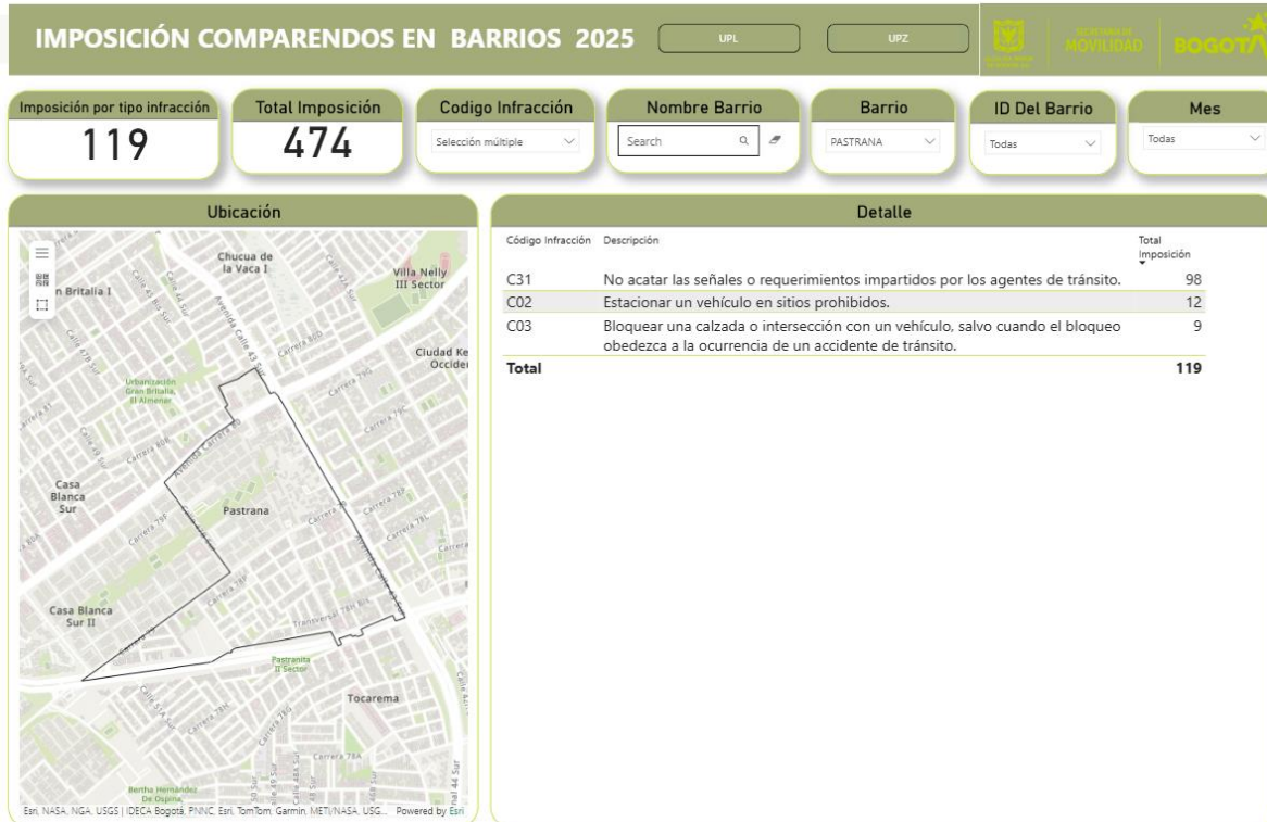
Periodo comprendido del 1 de enero al 31 de diciembre de 2025 y 1 de enero al 28 de febrero de 2026 1

Así las cosas, con relación a la ubicación, instalación o ejecución de cada actividad de control, es pertinente resaltar que estas se seguirán realizando en toda la malla vial de la ciudad conforme a la atención de las diversas problemáticas que se requieran intervenir; por tanto, los lugares o ubicaciones priorizadas varían por meses, días y hora.