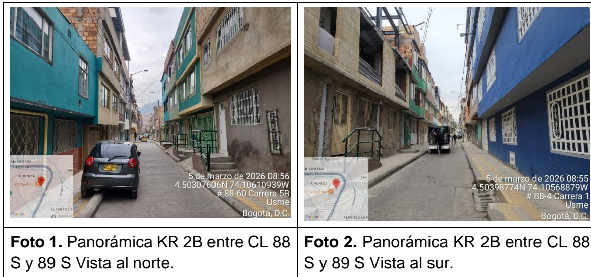
Tabla 2. Registro fotográfico visita técnica.

Ahora bien, desde la Subdirección de Señalización se realizó una visita técnica al sitio indicado en la solicitud el 5 de marzo de 2026. A continuación, se presenta el registro fotográfico de la visita técnica relacionada.