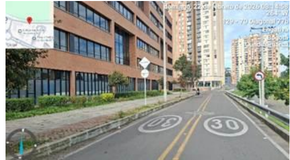
Foto 4. Panorámica CL 78C entre KR 130 y KR 129, vista al occidente.