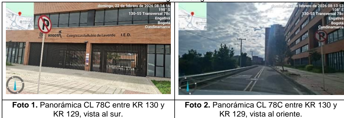
Tabla 1. Registro fotográfico

Este documento está suscrito con firma mecánica autorizada mediante Resolución No. 320 de diciembre 4 de 2020