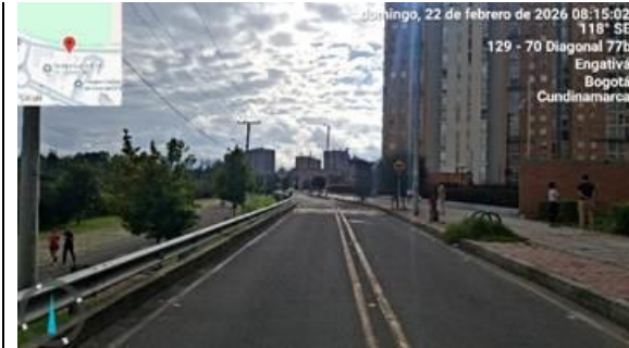
Foto 3. Panorámica CL 78C entre KR 130 y KR 129, vista al oriente.