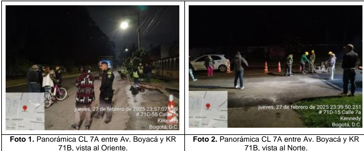
Foto 1. Panorámica CL 7A entre Av. Boyacá y KR 71B, vista al Oriente.