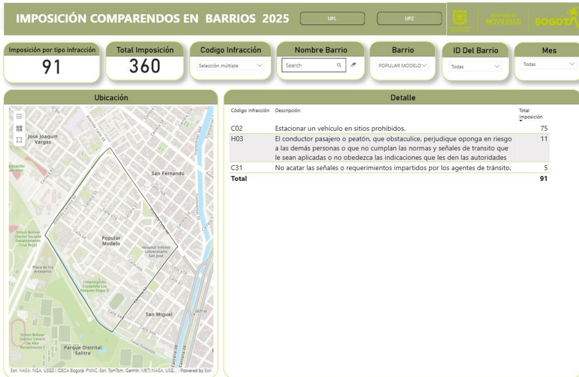
Periodo comprendido del 1 de enero al 31 de diciembre de 2025 1