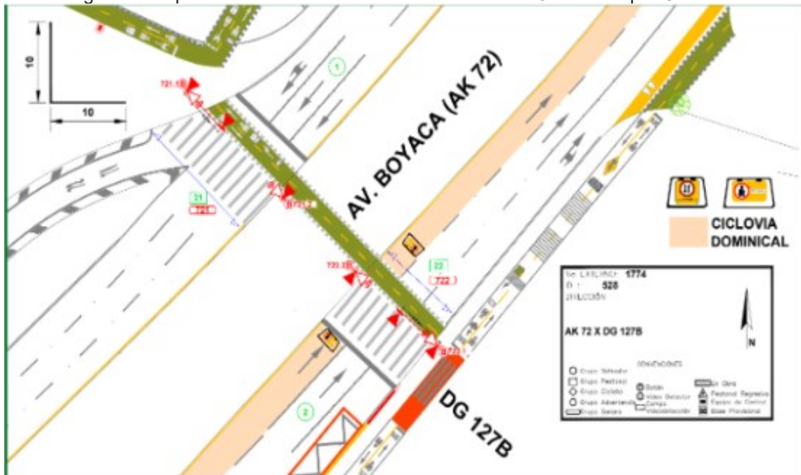
Figura 2. Esquema de la intersección Semaforizada Av. Carrera 72 por Calle 127A