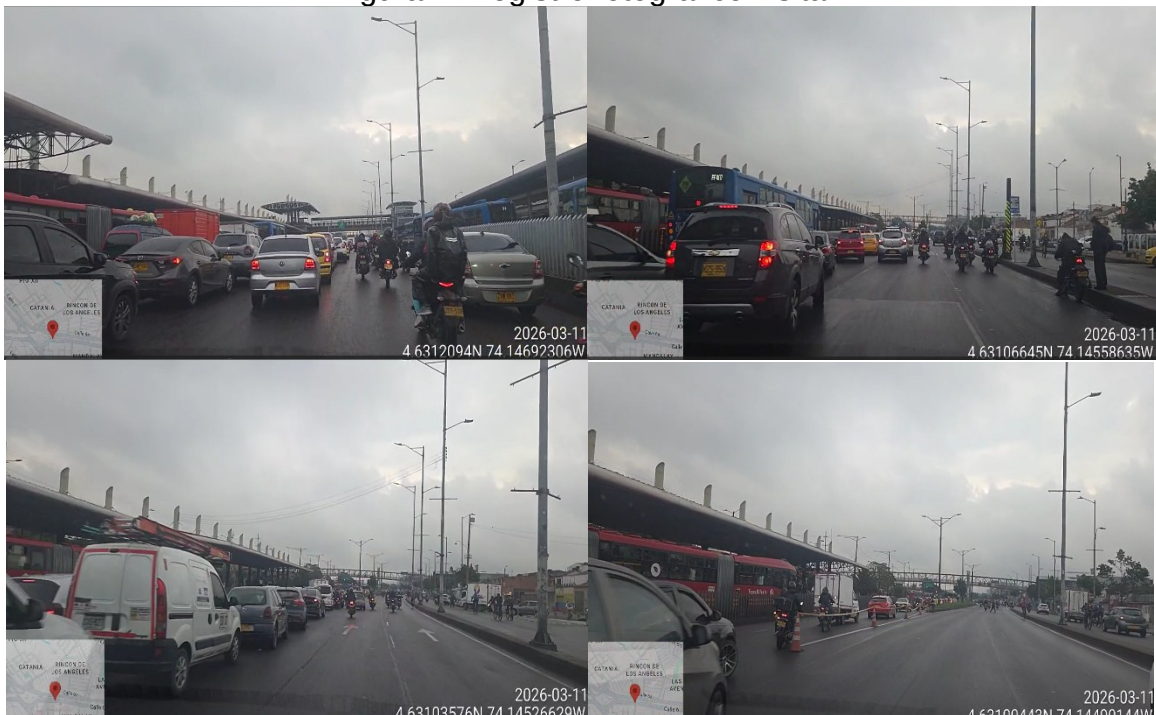
Figura 1. Registro fotográfico visita

Al respecto, es importante señalar que el carril de contraflujo implementado en este corredor es objeto de seguimiento y verificación periódica por parte de esta Subdirección, con el fin de evaluar sus condiciones de operación y funcionamiento. La más reciente visita de verificación fue realizada el 11 de marzo de 2026, cuyo registro fotográfico se presenta a continuación.