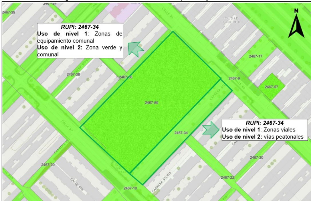
Figura 2. Información urbanística del espacio objeto de consulta.