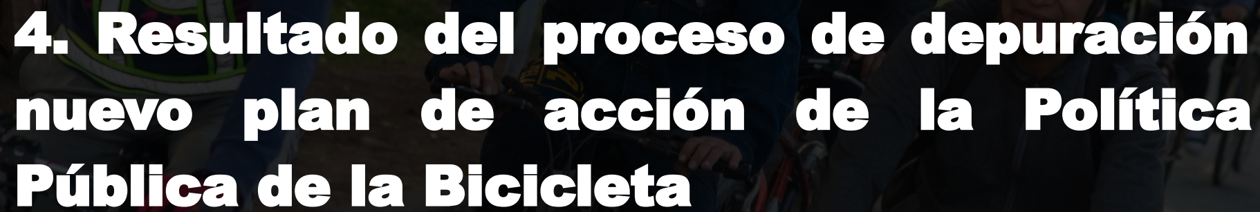
Imagen de Jhonatan Ramos / SDM