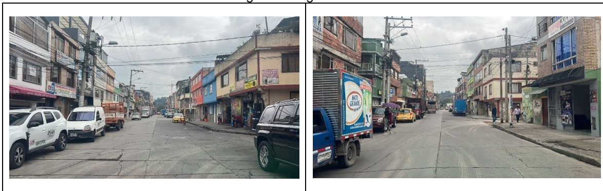
Tabla 1. Registro fotográfico visita técnica.

A continuación, se presenta el registro fotográfico de la visita técnica realizada el 20 de febrero de 2026.