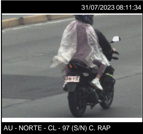
AU - NORTE - CL - 97 (S/N) C. RAP