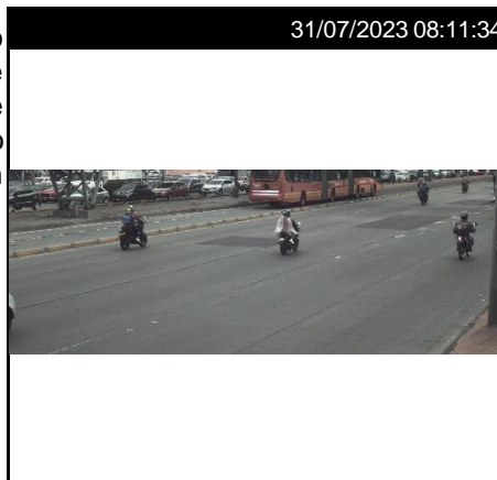
AU - NORTE - CL - 97 (S/N) C. RAP

La Secretaría Distrital de Movilidad le informa que, en cumplimiento de lo establecido en el inciso 3 del artículo 135 de la Ley 769 de 2002, modificado por el artículo 22 de la Ley 1383 de 2010, fue impuesta la orden de comparendo del asunto, por cuanto el vehículo de placa OHN93E fue evidenciado en la comisión de la infracción C.29.