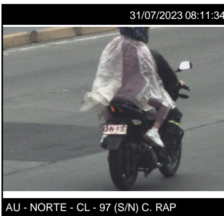
AU - NORTE - CL - 97 (S/N) C. RAP