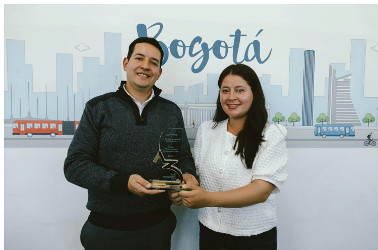
Ganadores del reto