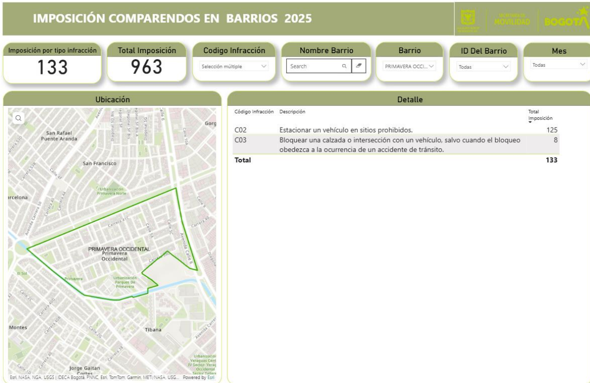
Periodo comprendido del 1 de enero al 31 de julio de 2025 1

Así las cosas, con relación a la ubicación, instalación o ejecución de cada actividad de control, es pertinente resaltar que estas se seguirán realizando en toda la malla vial de la ciudad conforme a la atención de las diversas problemáticas que se requieran intervenir; por tanto, los lugares o ubicaciones priorizadas varían por meses, días y hora.