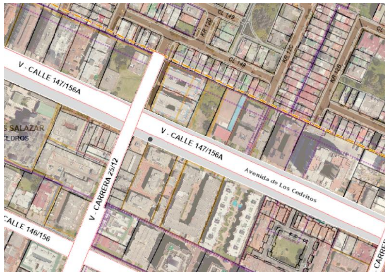
Figura 1. Consulta del plano: Malla vial