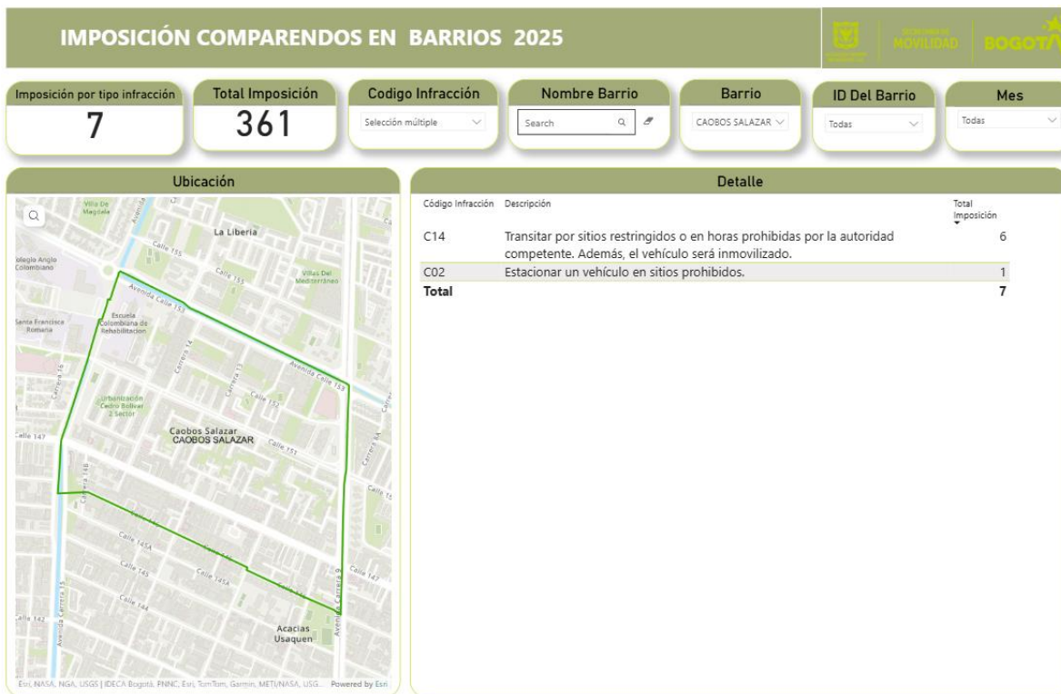
Periodo comprendido del 1 de enero al 30 de junio de 2025 1

De esta manera, se presentan los resultados de imposición de Órdenes de Comparendos Nacional realizadas: