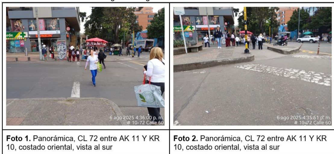
Tabla 2. Registro fotográfico CL 72 entre AK 11 Y KR 10

Con motivo de dar un alcance integral, la SDM realizó una visita técnica al sitio indicado en la solicitud el 06 de agosto de 2025. A continuación, se presenta el registro fotográfico de la visita técnica relacionada, donde se identifica la señalización dispuesta en el lugar objeto de análisis.