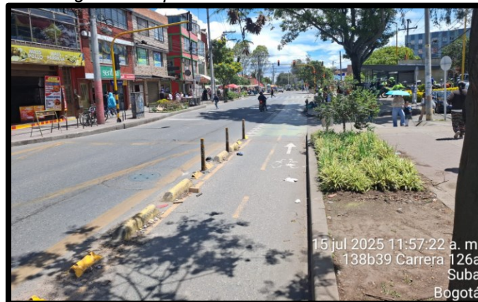
Imagen 4: Grupo vehicular 4 sin cola remanente.