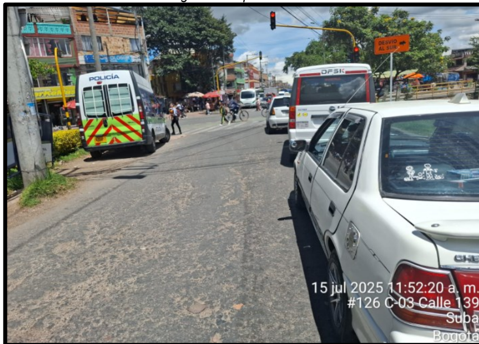
Imagen 2: Grupo vehicular 1