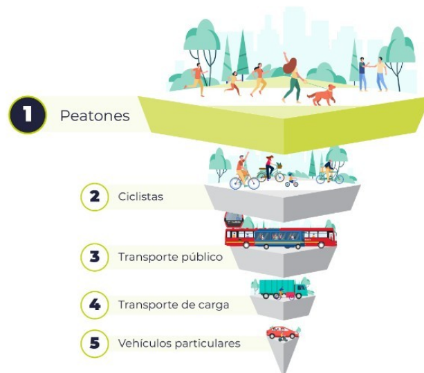
Ilustración 1. Pirámide inversa de movilidad