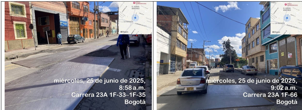
Fotografía 1 y 2. Carrera 23A entre Calle 1F y Calle 1H