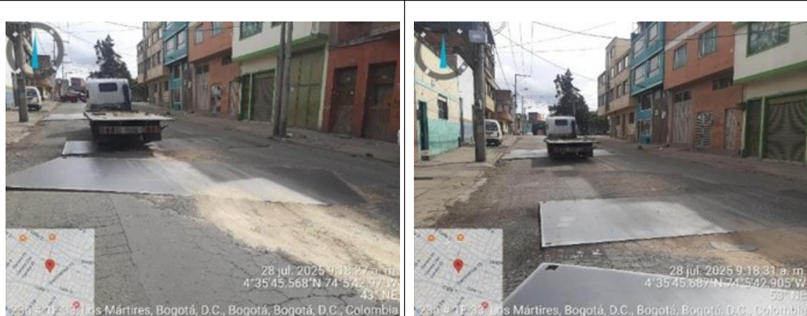
Fotografía 5 y 6. Carrera 23A entre Calle 1F y Calle 1H