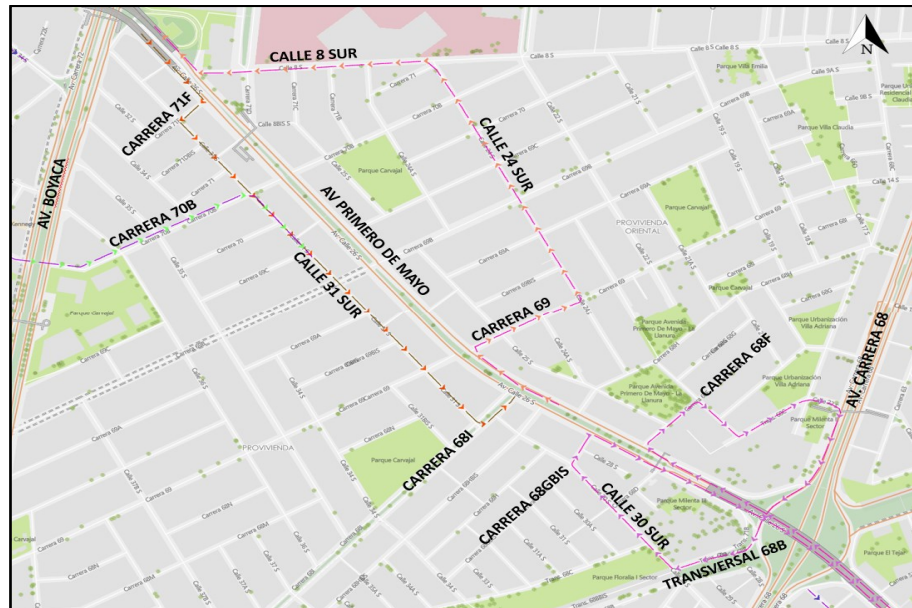
Mapa 2. Desvíos área de influencia Contrato EMB-163-2019.