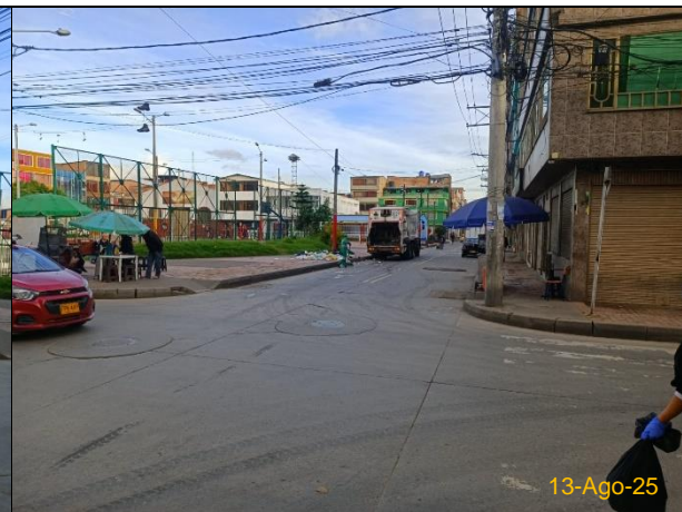
Foto 1. KR 82 con CI 5A S. Vista al sur.