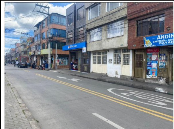
Foto 3. Panorámica KR 124 entre CL 126 y CL 134. Vista al sur