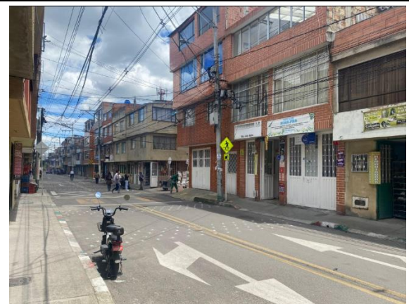
Foto 4. Panorámica KR 124 entre CL 126 y CL 134. Vista al sur