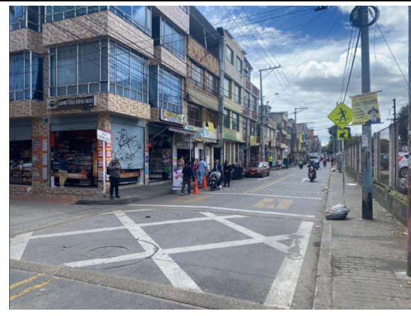
Foto 2. Panorámica KR 124 entre CL 126 y CL 134. Vista al norte