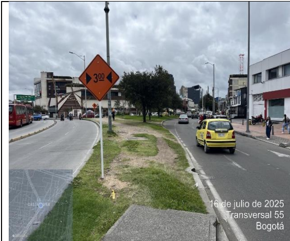
Foto No. 1 AK 50 con KR 49B, vista al Norte.