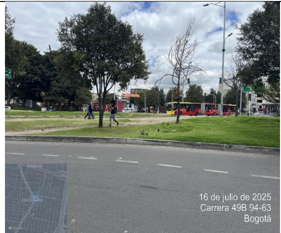
Foto No. 2. AK 50 con KR 49B, vista al Occidente.