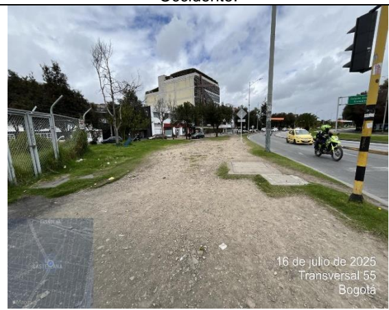
Foto No. 4 AK 50 con KR 49B, vista al Sur.