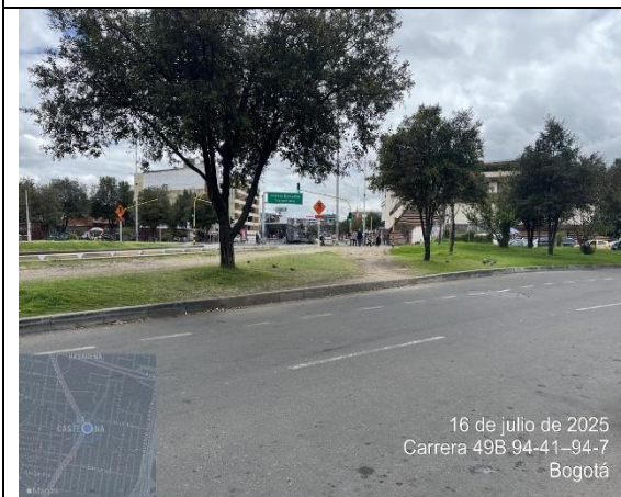
Foto No. 3 AK 50 con KR 49B, vista al Norte.