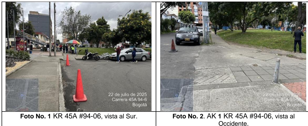
Tabla 1. Registro fotográfico visita técnica.

A continuación, se presenta registro fotográfico de la visita técnica el 22 de Julio de 2025.