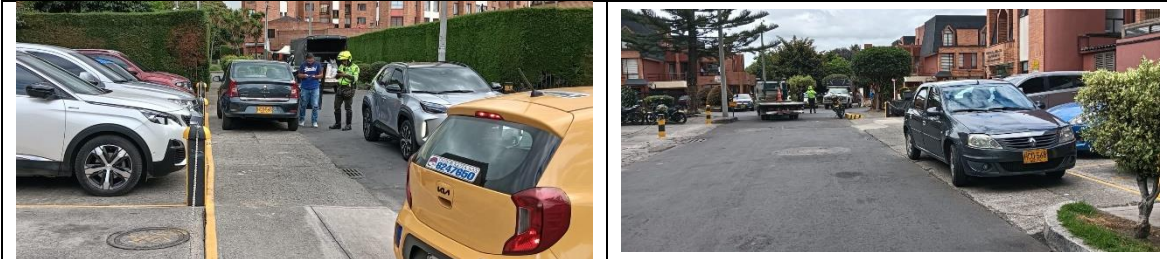
Fuente: Subdirección de Control de Tránsito y Transporte (SCTT) 12 de Noviembre de 2025

No obstante, en un amplio porcentaje los problemas de movilidad que se presentan en la ciudad corresponden a la falta de corresponsabilidad y cultura ciudadana de los actores viales como conductores pasajeros y peatones, quienes conocedores de los problemas de seguridad vial, de movilidad e invasión del espacio público generados por el irrespeto a las normas de tránsito, continúan con conductas de desacato reiteradas, desbordando la capacidad operativa de la Policía Metropolitana de Tránsito de la ciudad, a pesar de las diferentes campañas desarrolladas por la administración Distrital en torno a este tema; infiriéndose con esto que, aun cuando es responsabilidad de la Secretaría Distrital de Movilidad adoptar todas las medidas necesarias para garantizar la movilidad en condiciones de seguridad y comodidad a los usuarios, existe un deber de corresponsabilidad de los ciudadanos en el acatamiento de las normas como lo consagra el artículo 109 de la Ley 769 de 2002.