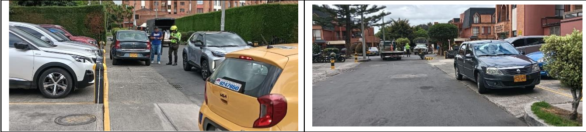
12 de Noviembre de 2025

No obstante, en un amplio porcentaje los problemas de movilidad que se presentan en la ciudad corresponden a la falta de corresponsabilidad y cultura ciudadana de los actores viales como conductores pasajeros y peatones, quienes conocedores de los problemas de seguridad vial, de movilidad e invasión del espacio público generados por el irrespeto a las normas de tránsito, continúan con conductas de desacato reiteradas, desbordando la capacidad operativa de la Policía Metropolitana de Tránsito de la ciudad, a pesar de las diferentes campañas desarrolladas por la administración Distrital en torno a este tema; infiriéndose con esto que, aun cuando es responsabilidad de la Secretaría Distrital de Movilidad adoptar todas las medidas necesarias para garantizar la movilidad en condiciones de seguridad y comodidad a los usuarios, existe un deber de corresponsabilidad de los ciudadanos en el acatamiento de las normas como lo consagra el artículo 109 de la Ley 769 de 2002.